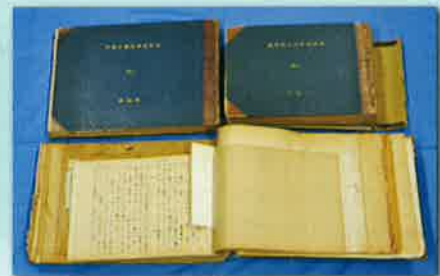
広島市が募集した原爆体験記の原稿 所蔵：広島市公文書館