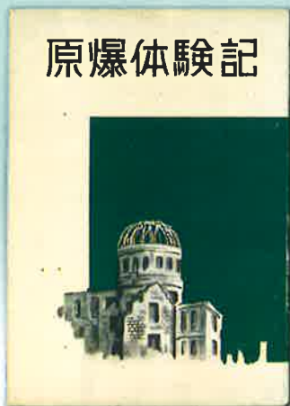
「原爆体験記」昭和25年(1950年) 広島平和協会