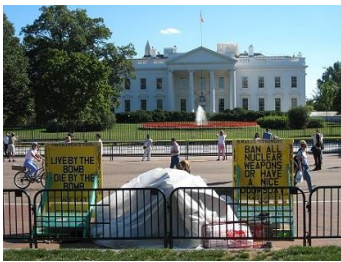
写真は「核兵器廃絶を求めると ホワイトハウスの前で座り込み」

【内容】歴代大統領と広島原爆投下や核兵器との関わりについて、日米の両国の研究者が解説します。