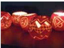
りんごのキャンドルホルダー