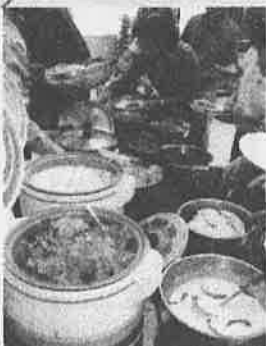
文化と技術の話し