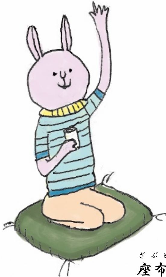
ざぶとん 座布团 Zabuton