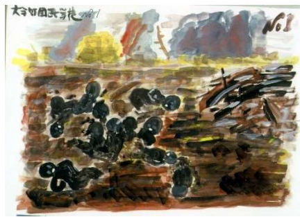
SG-0336 藤岡 久之作