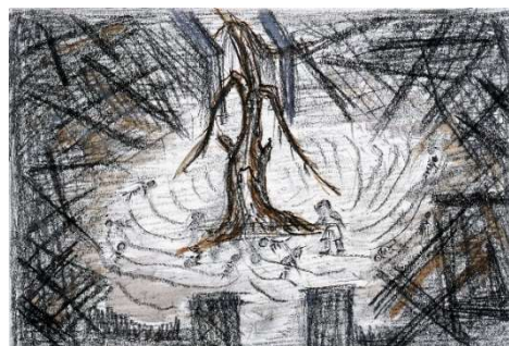
NG264-01 八木 義彦作