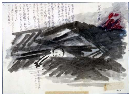
GE25-20 松村 智恵子作