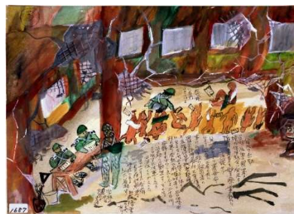
GE10-34 山下 正夫作