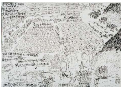
GE13-21 高田 満作

爆心地から 1,400m 東白島町 白島国民学校 六日の朝まで元気に遊んでいた友達