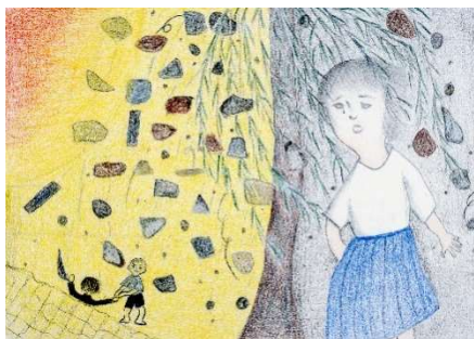
NG217 真鍋 美代喜作