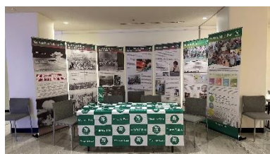
原爆平和展の様子

同会議の会期中、国連本部において、会議出席者や国連関係者に広島・長崎の被爆の実相や核兵器の非人道性、平和首長会議の取組について理解を深めてもらうため、平和首長会議原爆平和展、こどもたちによる“平和なまち”絵画展、VRゴーグル体験を開催した。VRゴーグルは1日当たり約80名が体験し、「こういう映像は大切だ。忘れてはならないものだと思う。」「平和が大切であることを強く感じた。」などの声があり、盛況を博した。