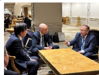
ラクメトゥリン議長（右）

オーナイ副会長は、平和首長会議のネットワークをさらに拡大し、より活発に活動し、市民社会において核兵器のない世界を目指すという総意を形成することが重要であり、その実現のため、カザフスタン国内の加盟都市拡大への支援を依頼した。ラクメトゥリン議長は、自治体の活動は政府を動かすこともできるのではないかとした上で、簡単にはいかないかもしれないが、広島・長崎が示すような核兵器廃絶につながる道を切り開くための市民のネットワークは重要であると述べた。