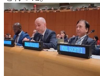
オーナイ副会長によるスピーチ