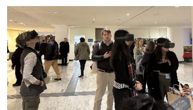
VRゴーグル体験の様子