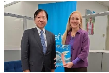
ファン・デル・ハイデン 事務局長 (右)

ファン・デル・ハイデン事務局長は、UNICEFはこどもが安心して生活できる環境を整えるとともに、安全保障面での担保を実現するための活動を行っており、日本からの支援に感謝していると述べた。香川事務総長は、核兵器に関しては国のみの問題ではなく、市民レベルで声を上げていくことが重要と述べるとともに、こどもの絵画コンテストなど、平和首長会議の具体的な取組への協力を依頼した。