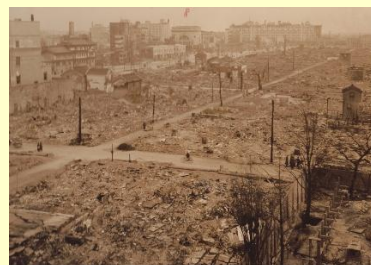
昭和20年3月13-14日の 第一次大阪大空襲後の心斎橋 付近