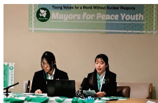
ユースフォーラムでの様子

現地では、NPT再検討会議のサイドイベントとして国連本部で開催された平和首長会議のユースフォーラムに