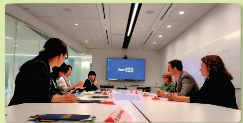
ペース大学で 学生・教員との ディスカッションを行う 平和首長会議コース