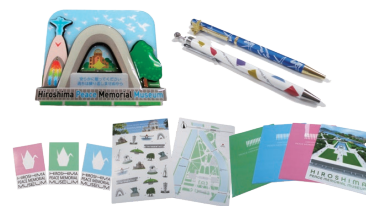
新たに加わったオリジナルグッズ

ます。これらは、（公財）広島平和文化センターの職員がデザインを考案して制作しました。クリアファイルの裏面には、「力や恐怖ではなく、様々な違いを乗り越えて、人類の共通の価値を大切に