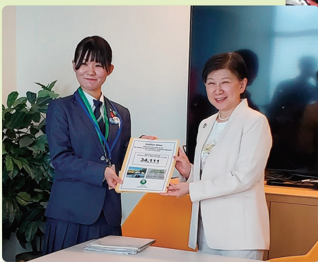
国連で中満事務次長へ 「核兵器禁止条約」の早期締結を求める 署名を手交する平和首長会議コース