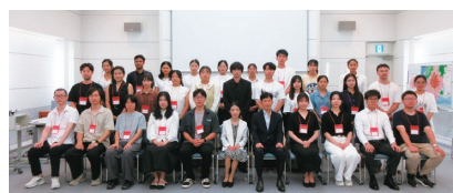
令和7年度ひろしま奨学金奨学生決定書交付式の様子

広島市内の大学・大学院等に在学し、かつ広島市内に居住する外国人私費留学生を対象に、昭和63年度（1988年度）より開始し、毎年30人の留学生に奨学金を支給しています。