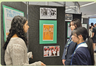
国連国際学校で ギャラリーウォークに参加する 平和首長会議コース