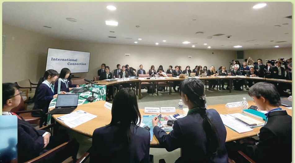
NPT再検討会議コースフォーラムを 主催する平和首長会議コース