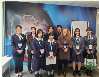
UNHCR(国連難民高等弁務官事務所)を 訪問する平和首長会議コース