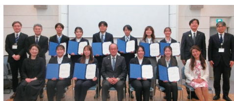
提言報告会(令和8年3月)

提言では、SNSを使って若者による意識の変化を起こすことで核兵器廃絶に向けた政策を推進する、若者が平和について気