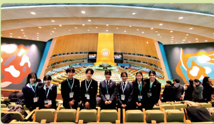
平和首長会議コース (国連総会議場にて)